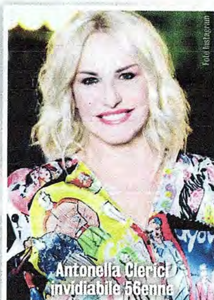
Antonella Clerici invidiabile 56enne

P uò creare vari inconvenienti quali aumento di peso, vampate o sbalzi di umore: la menopausa si presenta in media intorno ai 50 anni e provoca cambiamenti tali che possono ripercuotersi sulla qualità della vita. Oggi, grazie a una terapia rivoluzionaria ma dolce, si può stare meglio e affrontare la menopausa con serenità. In questa fase, le ovaie rallentano la loro funzionalità, diminuendo la produzione di estrogeni, gli ormoni femminili. È un mutamento che va a sfociare nella scomparsa graduale del ciclo mestruale, con una conseguente serie di disturbi psicofisici spesso fastidiosi, come un calo del desiderio, secchezza vaginale e insonnia.